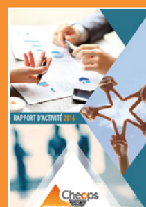
Le rapport d'activité