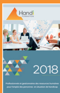
Le catalogue Handi-formation